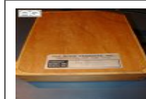
Varie TICE TPT: Line... € 100,00